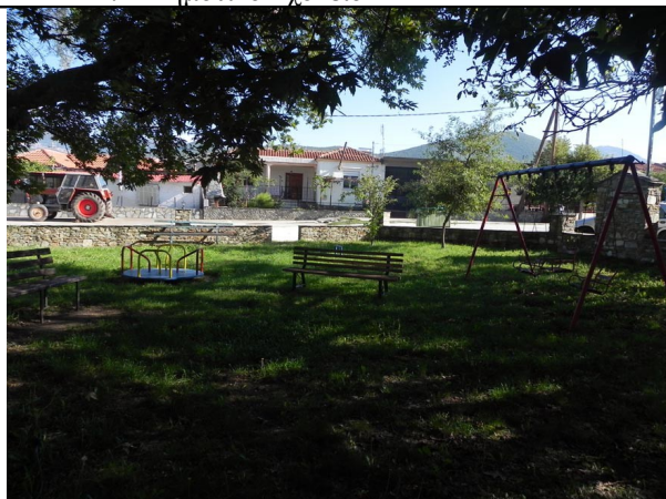
3. Πάρκο “Λιολιάδες”