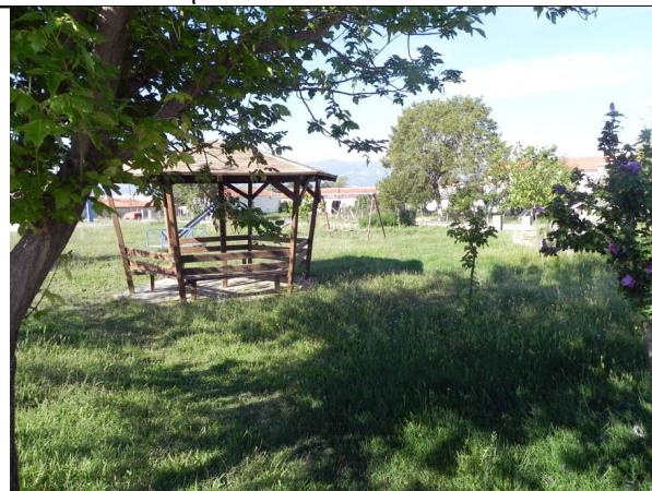
4. Πάρκο “Μετόχι”