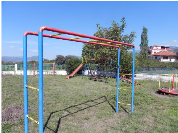
1. Δημοτικό Σχολείο